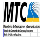
Cuadro 05: MATRIZ UNICA DE PASAJEROS EN CANTIDAD DE PASAJEROS, CATEGORIA LIGEROS + BUSES

Ministerio de Transportes y Comunicaciones