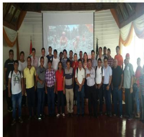
Personal Técnico de los Organismos Proponentes (diferentes gobiernos locales).