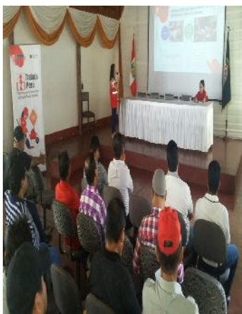
Taller de Asistencia Técnica a Organismos Proponentes en el marco del Concurso de Proyectos Regulares 2018.