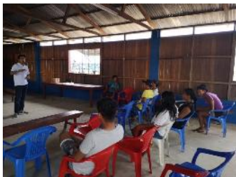
Canaan de Cachiyacu 04/07/2018

D) Taller de validación de idea de negocio y habilidades blandas , del 04 al 05 de julio del presente año, se realizó un “Taller en Habilidades Blandas” en la comunidad nativa de Canaán de Cachiyacu y Pahoyan.