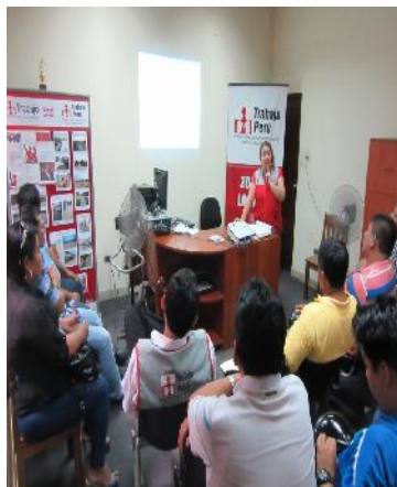
Asistencia Técnica organismos Proponentes en el marco del Concurso de Proyectos Regulares 2018.