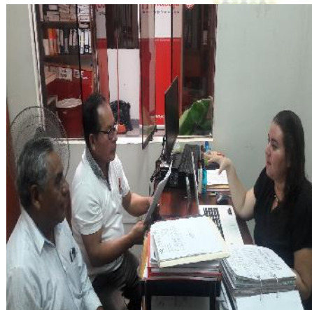
Responsable de Proyectos realizando Asistencia Técnica en la Unidad Zonal Loreto.