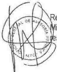
VERÓNICA ZAVALA LOMBARDI Ministra de Transportes y Comunicaciones